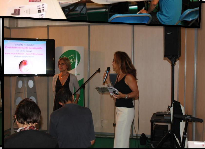
Atelier : « Gestes qui sauvent »